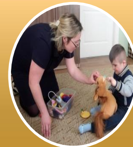
Деятельность консультационных пунктов для семей, воспитывающих детей**

Развитие психолого-педагогической компетентности современного родителя