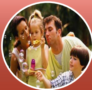
Организация совместного досуга