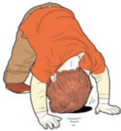
Может сильно стучать головой о твердую поверхность (пол, стену)