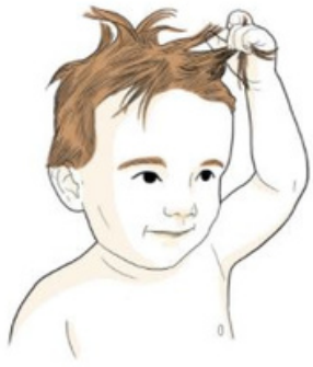
Может вырывать у себя волосы ключьями